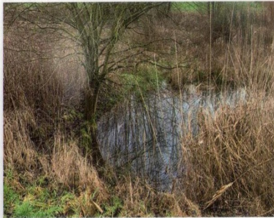
Grundstück im Hakental.

Woche der Natur 15. bis 23. Juni mit Unterstützung von BINGO Lotto