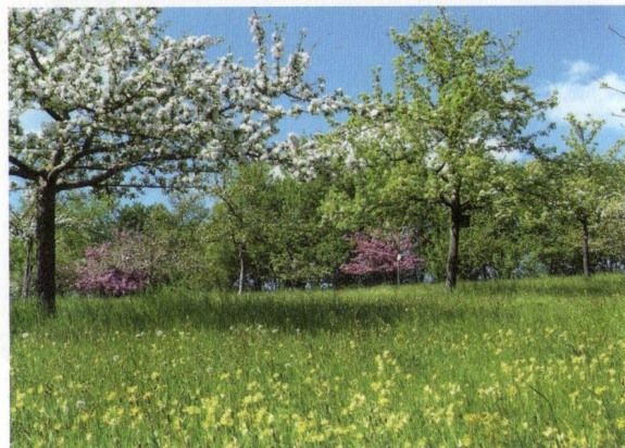
Streuobstwiese Kirchberg.

So, 28. April: Tag der Streuobstwiese: Besuch der Streuobstwiese Kirchberg Entwicklung, Bestand, Pflege, Patenschaften, Fauna und Flora Treffpunkt: 10.00 Uhr, Bleichestelle, Mitfahrgelegenheit; 10.15 Uhr Ecke Bergstraße/Schillerstraße, dann zu Fuß Dauer: Ca. 3 Stunden Leitung: NABU-Team