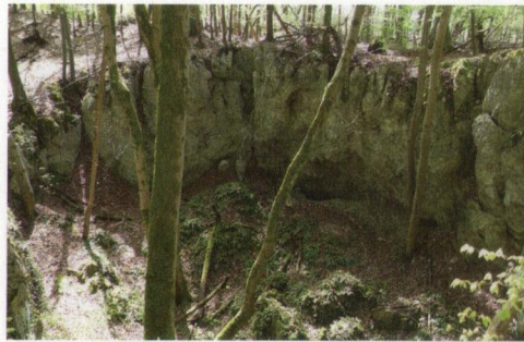
Erdfall im Hainholz

So, 23. Juni: Von Schlotten, Hirschzungen und einem geheimnisvollen Teich - eine geologisch-faunistisch-botanische Sonntagsexkursion